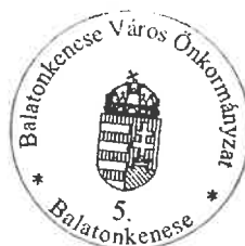
Heppell Ildikó beruházási ügyintéző